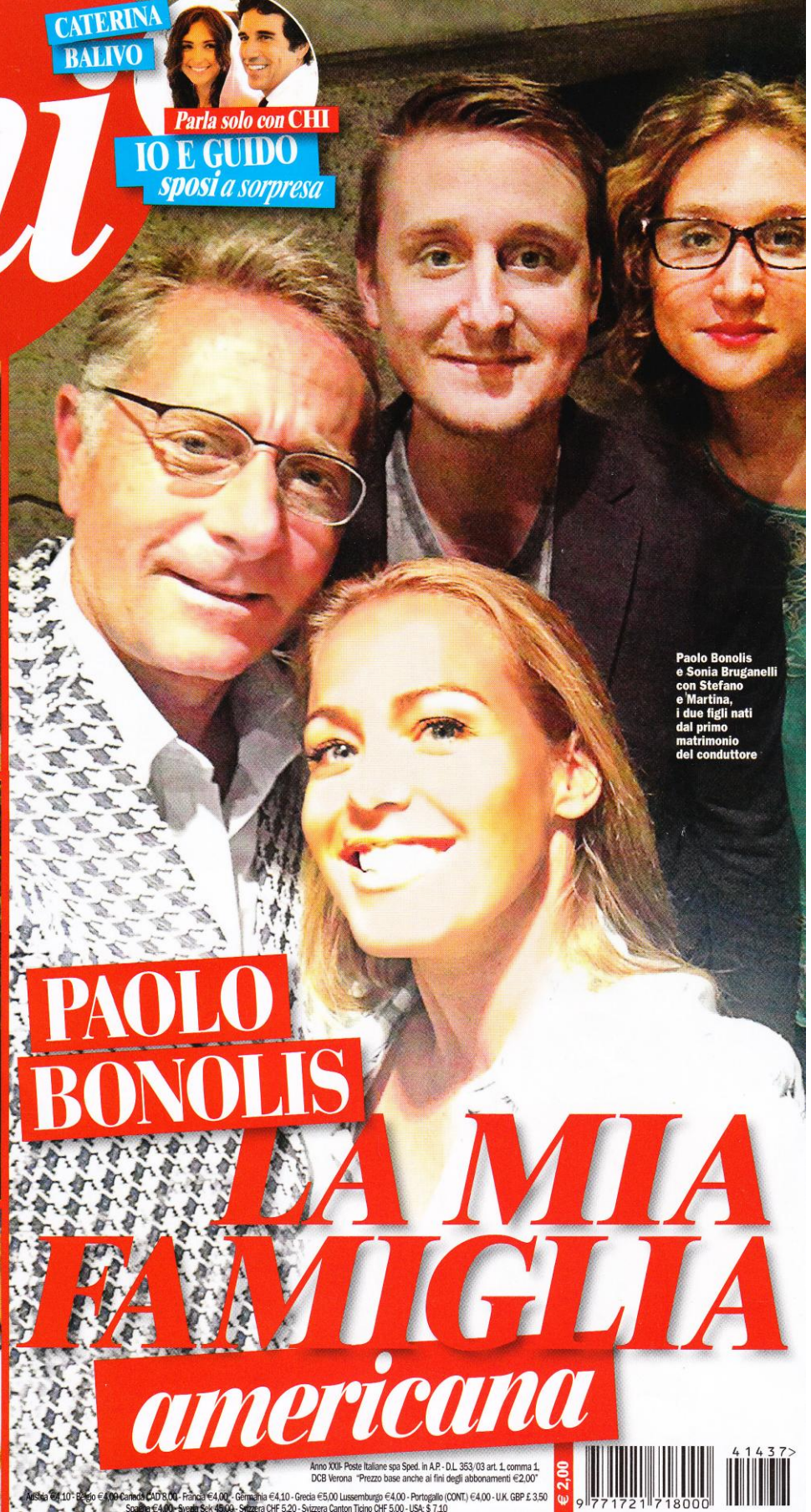
Paolo Bonolis e Sonia Briganelli con Stefano e Martina, i due figli nati dal primo matrimonio del conduttore